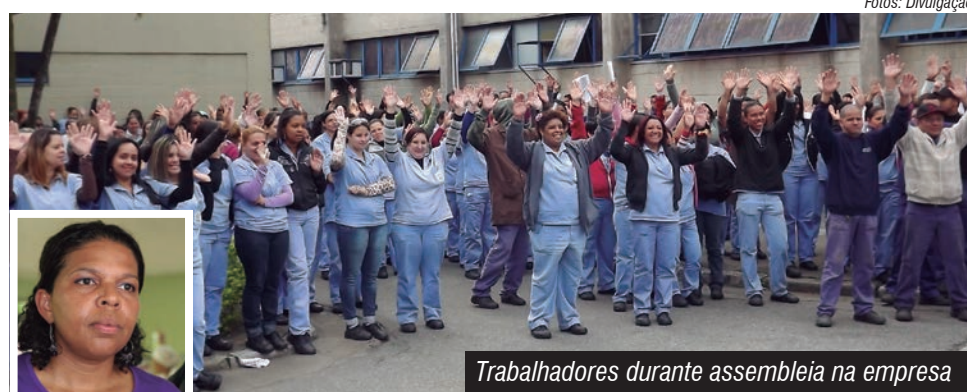
Trabalhadores durante assembleia na empresa

Durante assembleia realizada na última terça, os trabalhadores na Apis Delta, em Diadema, rejeitaram a proposta de PLR feita pela empresa.