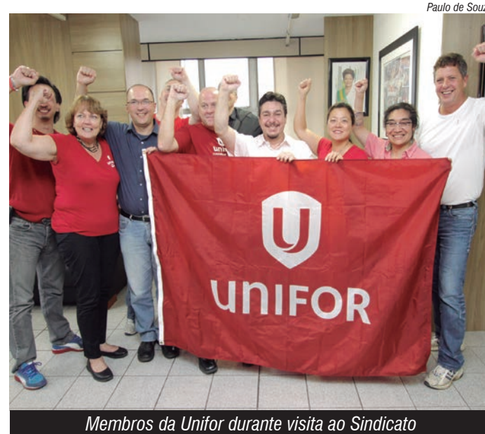
Membros da Unifor durante visita ao Sindicato

"Os canadenses querem entender como é a relação da categoria com a CUT e todas as estratégias adotadas na luta para garantir os direitos dos trabalhadores, inclusive a organização de trabalho na base", afirmou.