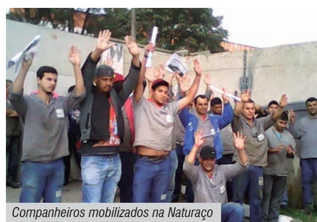
Companheiros mobilizados na Natureza

"Caso contrário, os companheiros já se mostraram dispostos a lutar para conquistar a PLR deste ano", concluiu a dirigente.